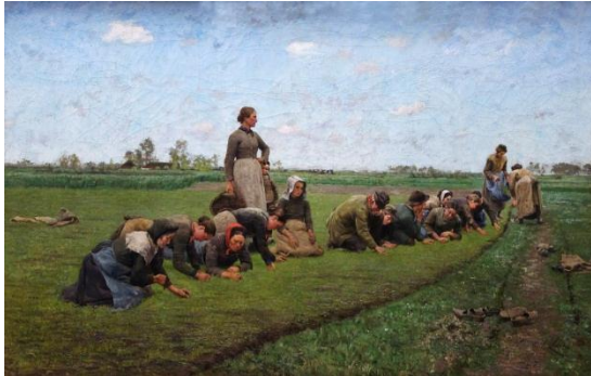
Emile Claus, Vlas wieden in Vlaanderen (1887)

De weg naar welvaart is hard, harder dan klimmen tot de wolken. Noeste boeren uit de streek rond Kortrijk bewerkten het vlas. Niets verbond hen met de zijderoute. Het oosten was ver, hun wijzen ondoorgrondelijk. Maar toen de aarde daverde, de economie tuimelde en velen hun werk verloren, Toen werden de vlasboeren topindustriëlen. Akkers werden forse industrieterreinen. Vandaag steken ze de bergen over. Van de Gouden Leie tot voorbij de Gele Rivier. (vrij naar Li Bai (李白), 'The road to Shu is hard', Tang Dynasty)