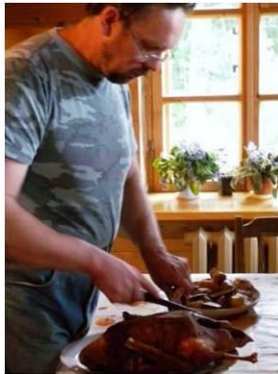
Prospectie Gateway naar Rusland, juni 2009