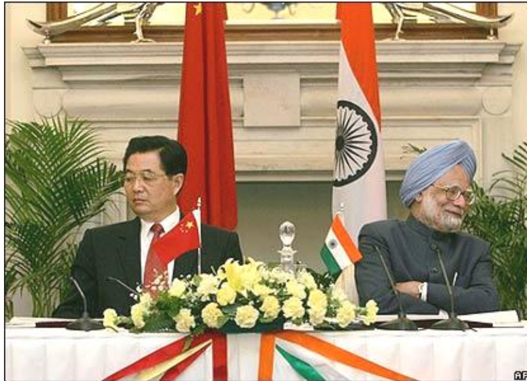
Babel in de Jachtlaan