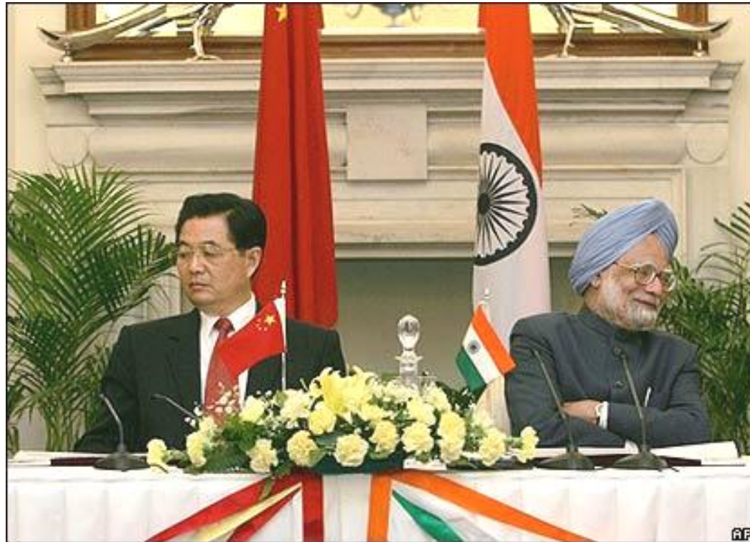
Babbel in de Jachtlaan